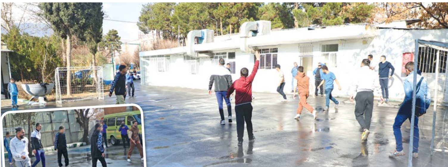
رویارویی جذاب فوتبالبایست های پیکان و کودکان دارالقرار