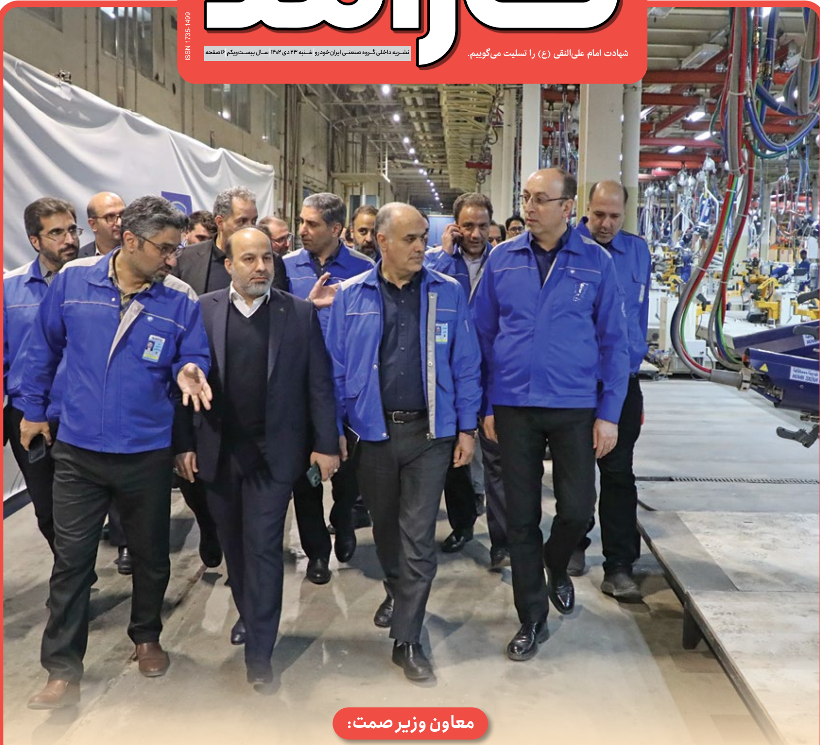
معاون وزیر صمت: