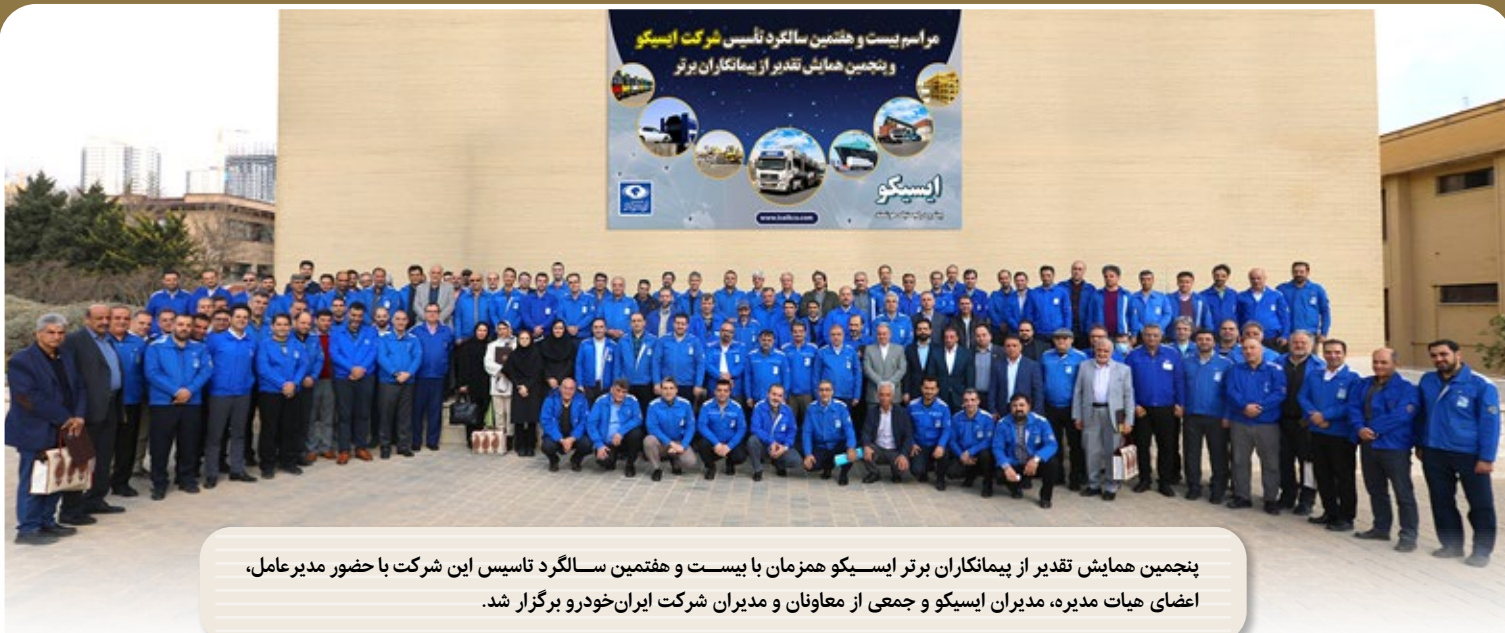
پنجمین همایش تقدیر از پیمانکاران برتر ایسیکو همزمان با بیست و هفتمین سالگرد تأسیس این شرکت با حضور مدیرعامل، اعضای هیات مدیره، مدیران ایسیکو و جمعی از معاونان و مدیران شرکت ایران خودرو برگزار شد.

معرفی کند، بلکه هدف این است که در نوع خود بهترین باشد، شرکتی که بیشترین خدمات را با بهترین کیفیت به مشتریان ارائه داده و فعالیت‌های خود را با این رویکرد گسترش دهد.