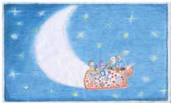
پاسمن قناعتی فرزند رضا