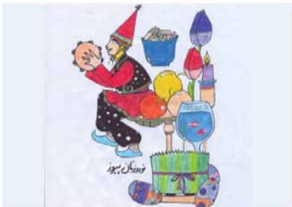
علی جهانگیری فرزند مجید