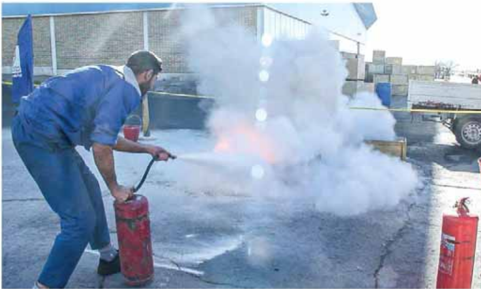
شرکت ایران خودرو خراسان برگزار کرد