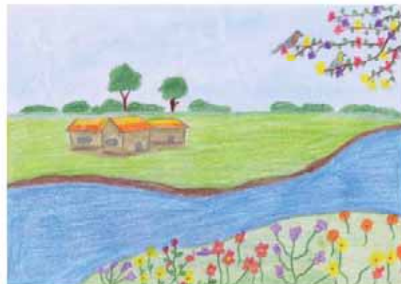
تینا نوزنده جانی فرزند هادی