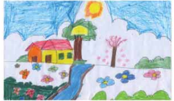
رضوانه رحمانی فرزند رضا