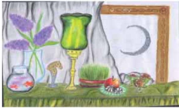
ستایش زارع صفت فرزند مرتضی