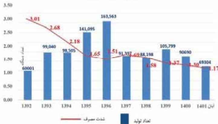
شدت مصرف آب در سالهای مختلف

اقدامی دیگر در راستای مسئولیت های اجتماعی شرکت ایران خودرو خراسان