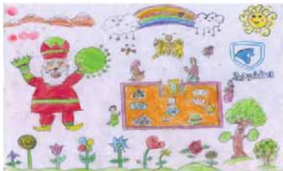
دیانا کیانوش مقدم فرزند شاهرخ