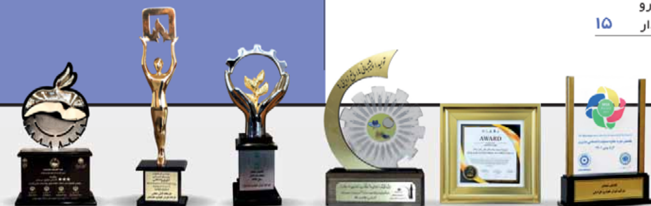
تندیس جشنواره ملی صنعت سلامت محور