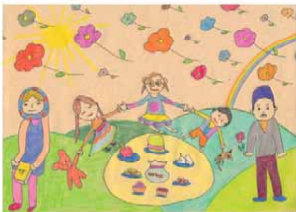
مهتا شریعت زاده فرزند پیمان