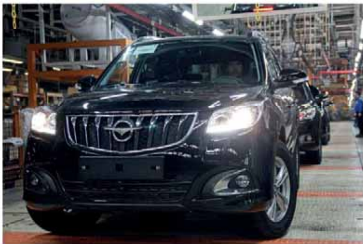
مدیرعامل شرکت ایران خودرو و خراسان خبر داد