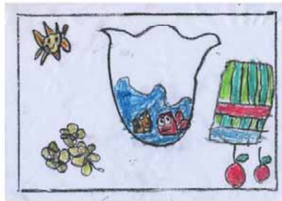
شادی کهندل فرزند حسین