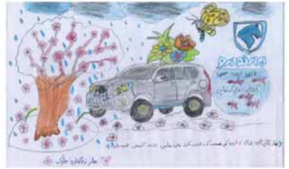
نازنین زینب حیدری فرزند رمضانعلی