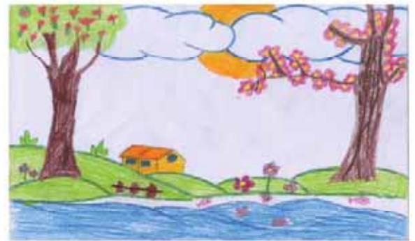
فاطمه فولادین فرزند مجید