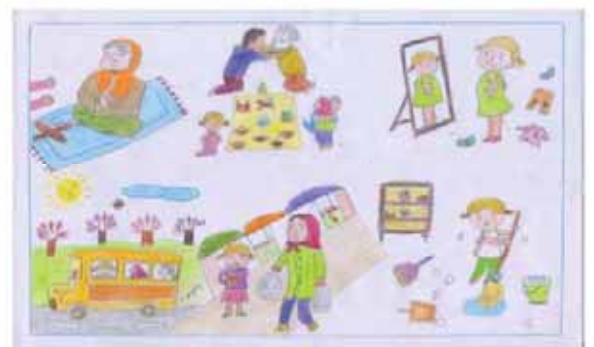
کیمیا حسینی فرزند حسین