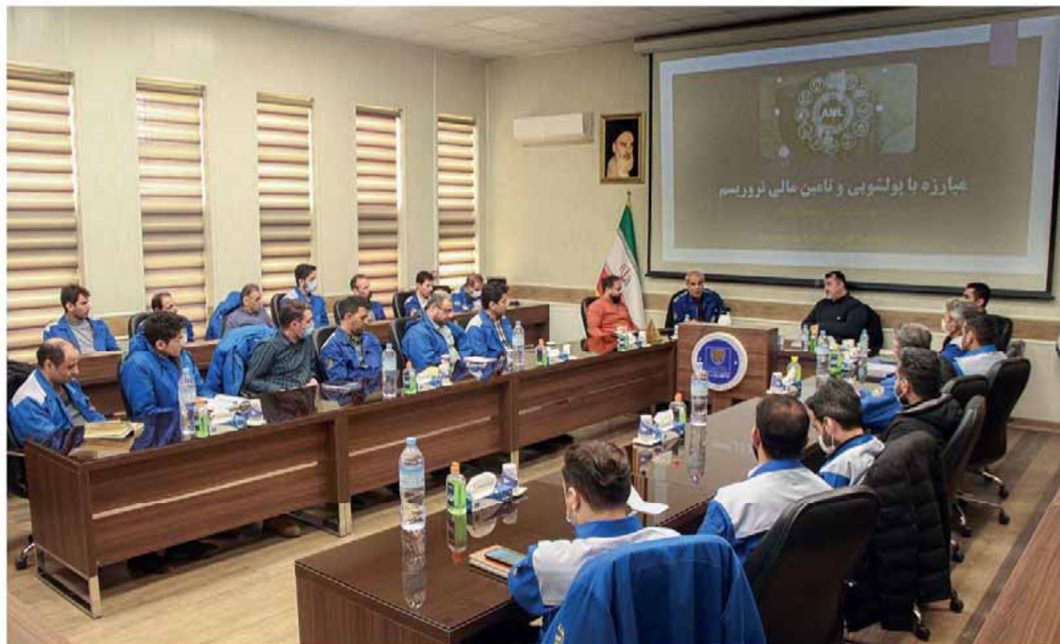
مدیر مبارزه با پولشویی گروه صنعتی ایران خودرو بیان کرد