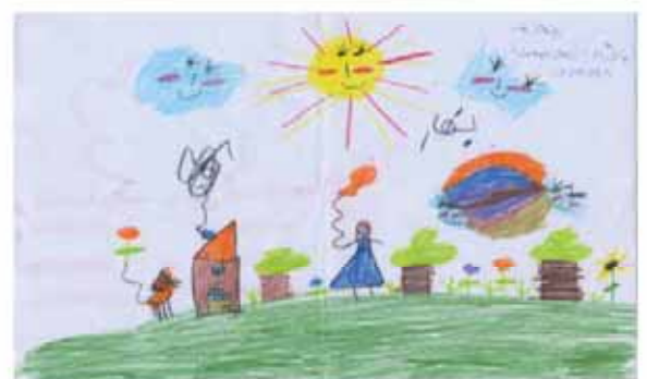
دنیز ناصری فرزند هومن