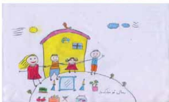
نگار وفادوست فرزند جعفر