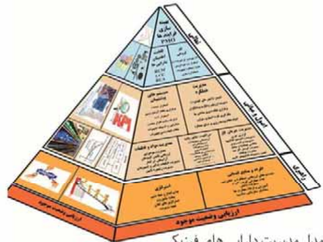
● مدل مدیریت دارایی های فیزیکی