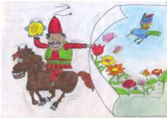
حسین توکلی فرزند حمزه