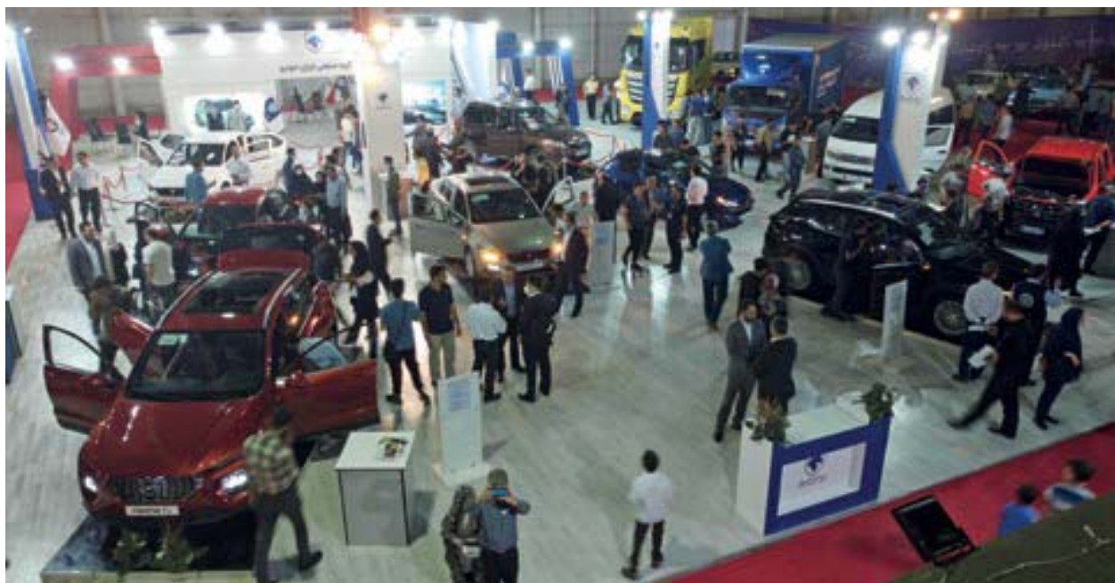
بیست و دومین نمایشگاه بین المللی خودرو مشهد