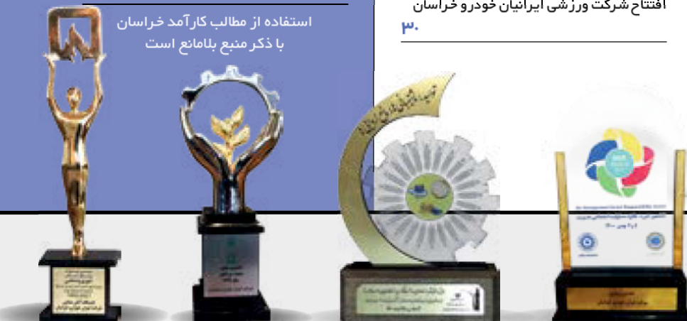
تندیس برتری مسئولیت‌پذیری اجتماعی تندیس سیمین کنترل کیفیت تندیس ایستگاه برتر آتش نشانی صنعت کشور کنترل کیفیت کار فرمایان سلامت محور برتر